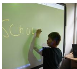
Einsatz des Smartboards im Unterricht

Kontakt: MAXIMILIAN-KOLBE-SCHULE FÖRDERSCHULE Schwerpunkt Lernen und Geistige Entwicklung Hohes Ufer 1-3 49624 Löningen