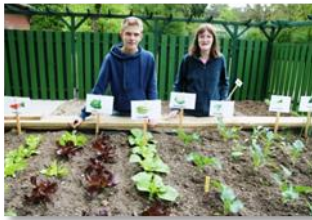
Schulgarten planen, anlegen, pflegen, ernten, verarbeiten und verkaufen