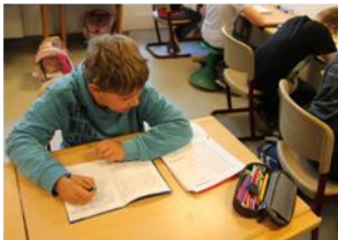
Kulturtechniken Deutsch und Mathematik