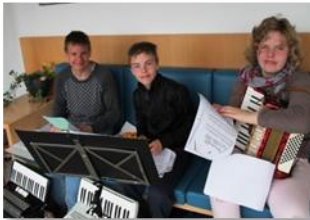
Chorprojekt im Altenzentrum