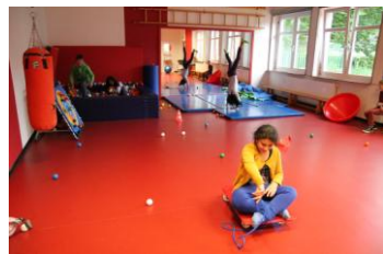
Therapien und Übungen im Psychomotorikraum